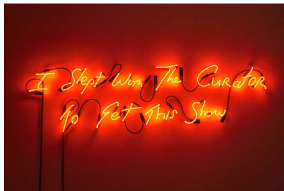
Maurice Doherty, I Slept With The Curator To Get This Show , Neon, 2016.

Slapstick, Deadpan, Wit and Irony – The Double Act of Art and Comedy